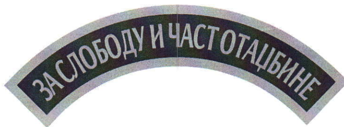
Слика 118: Идејно решење изгледа ленте за теренску униформу

На слици 118. дат је приказ идејног решења изгледа ленте за теренску униформу.