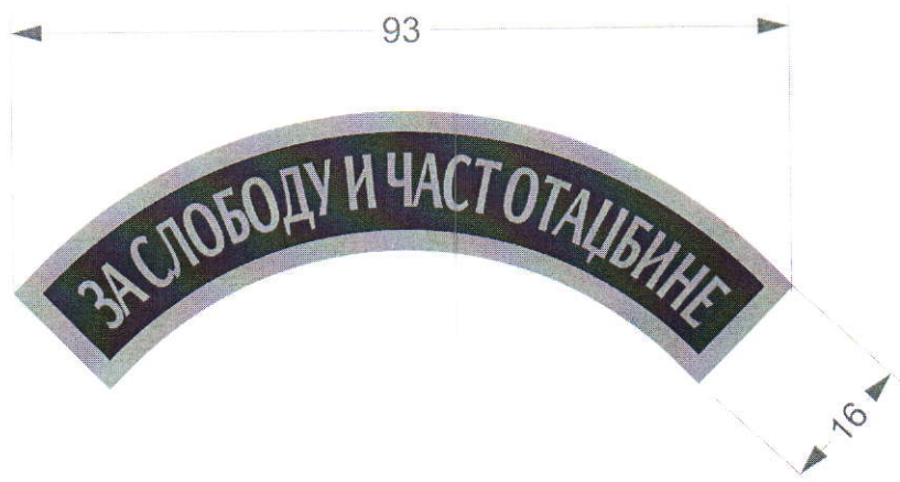
Слика 119: Димензије ленте за теренску униформу

Димензије ленте за теренску униформу приказане су на слици 119.